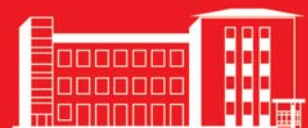
APOTHEKE an der Bornheimer Straße

Theaterplatz 13 53177 Bonn - Bad Godesberg Tel. 02 28 - 35 33 35 Fax 02 28 - 3 67 04 09