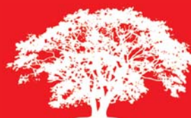
KURPARK APOTHEKE Godesberg

Mainzer Str. 155 53179 Bonn - Bad Godesberg Tel. 02 28 - 92 12 26 0 Fax 02 28 - 92 12 26-29