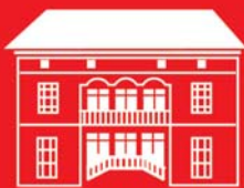
ALTE APOTHEKE Godesberg

Koblenzer Straße 58 53173 Bonn - Bad Godesberg Tel. 02 28 - 35 30-01 Fax 02 28 - 35 30-03