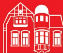
ALTE APOTHEKE in Mehlem

Koblenzer Straße 58 53173 Bonn - Bad Godesberg Tel. 02 28 - 35 30-01 Fax 02 28 - 35 30-03